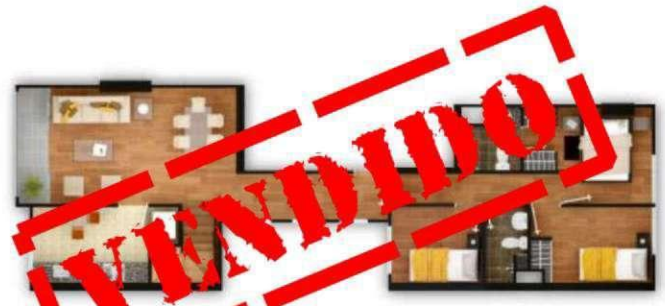
DPTO DUPLEX 601 área ocupada : 169.6 m2 área techada : 124.5 m2 área libre : 45.1 m2