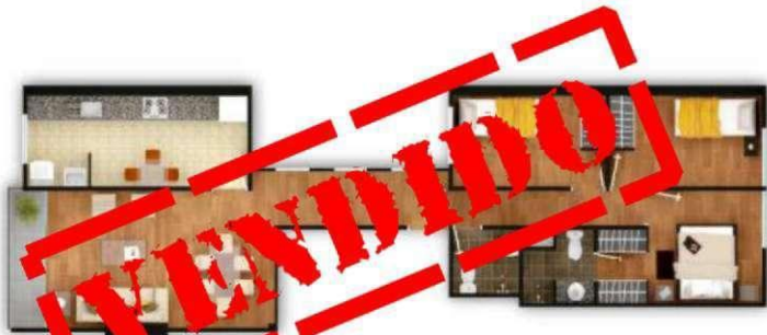
DPTO 202 al 502 área ocupada : 83.6 m2 área techada : 83.6 m2