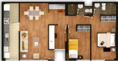
DPTO 203 al 403 área ocupada : 70.3 m2 área techada : 70.3 m2