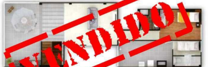
DPTO DUPLEX 601